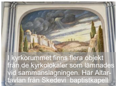
I kyrkorummet finns flera objekt från de kyrkolokaler som lämnades vid sammanslagningen. Här Altartavlan från Skedevi baptistkapell

1932 skedde en stor splittring av församlingen, fler än 120 medlemmar och dåvarande pastorer valde att lämna församlingen och bilda en ny församling. Trots stor smärta för alla inblandade så fanns ändå en stor generositet då den nya församlingen som gåva fick missionshusen på Åsen och i Läppe.