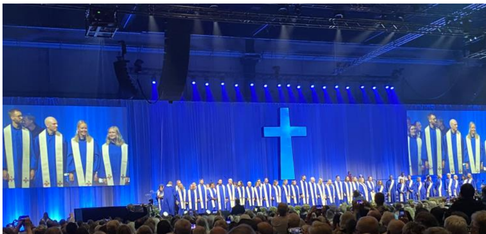
Pastorer och diakoner som ordinerades vid kyrkokonferensen