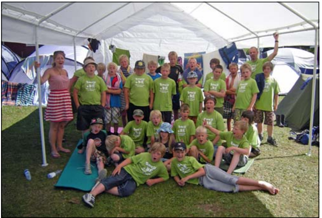
Glada och varma barn på Smajllägret.